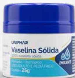
Vaselina Sólida 25g

CÓD C0010053 EAN 7898031313533 NCM 3304.99.90 CXP 72