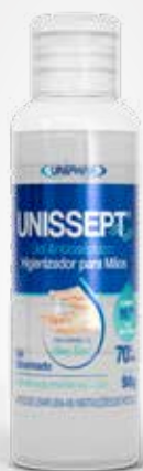
Unissept Álcool 70 em Gel 90g

CÓD C0010037 EAN 7898031310600 NCM 3402.41.90 CXP 12