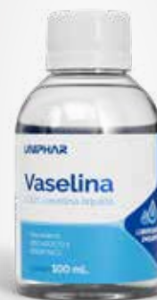
Vaselina Líquida 100mL

CÓD C0010060 EAN 7898031310273 NCM 3304.99.90 CXP 12