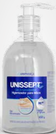
Unissept Álcool 70 em Gel 450g

CÓD C0010037 EAN 7898031310600 NCM 3402.41.90 CXP 12