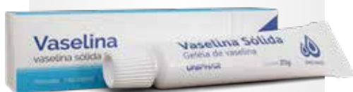
Vaselina Sólida 20g

CÓD C0010052 EAN 7898031310990 NCM 3304.99.90 CXP 48