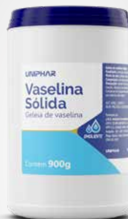
Vaselina Sólida 900g

CÓD C0010049 EAN 7898031310495 NCM 3304.99.90 CXP 120