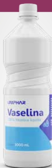
Vaselina Líquida 1000mL

CÓD C0010041 EAN 7898031310877 NCM 3402.41.90 CXP 144